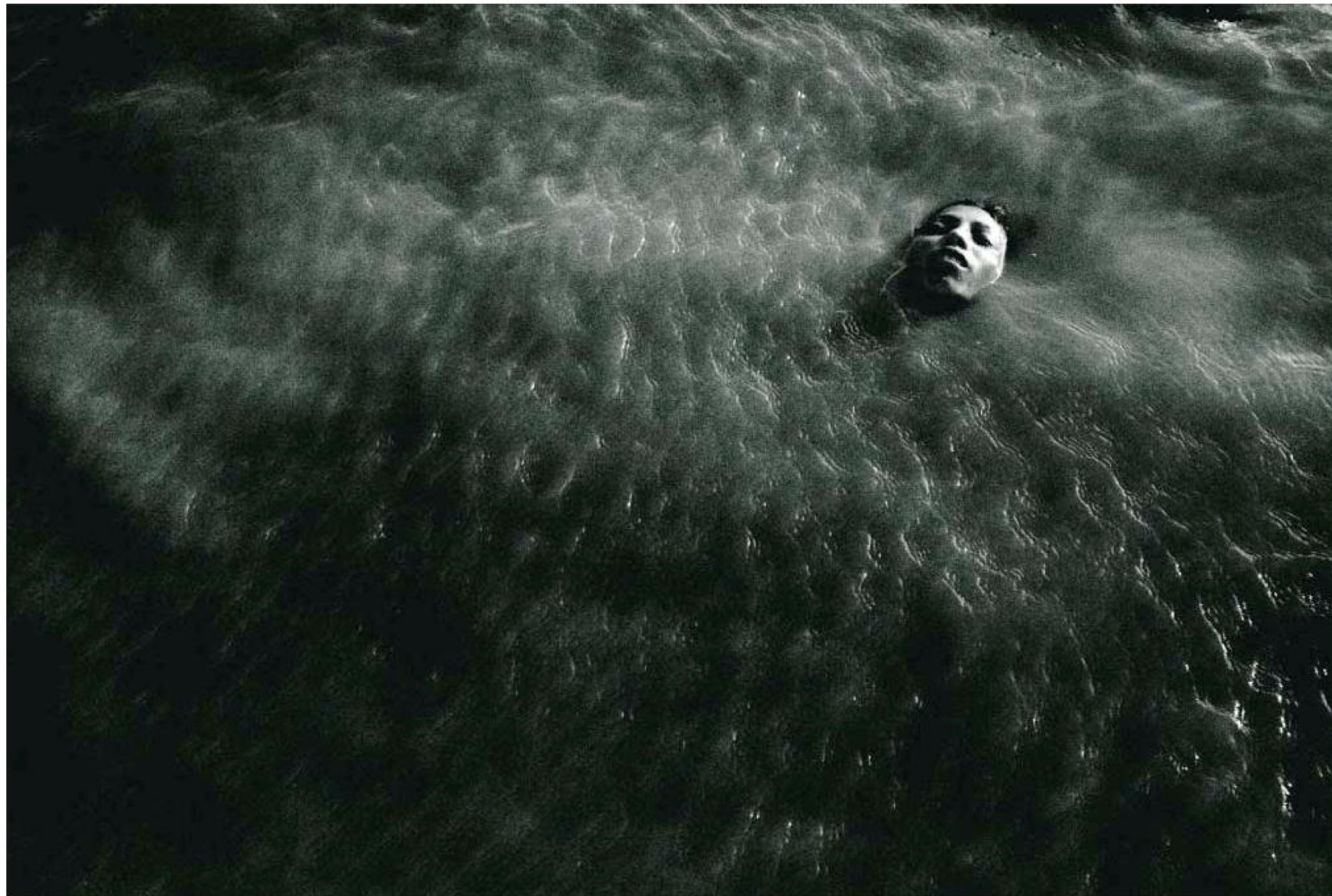
KUZIARTEK. Børnene bruger store dele af dagen ude i vandhuller i muddret, hvor de leder efter fisk, som de kan sælge på det lokale marked tre timers gåtur fra Kuziartek. Nogle gange holder de også pauser fra arbejdet for at lege i vandet.