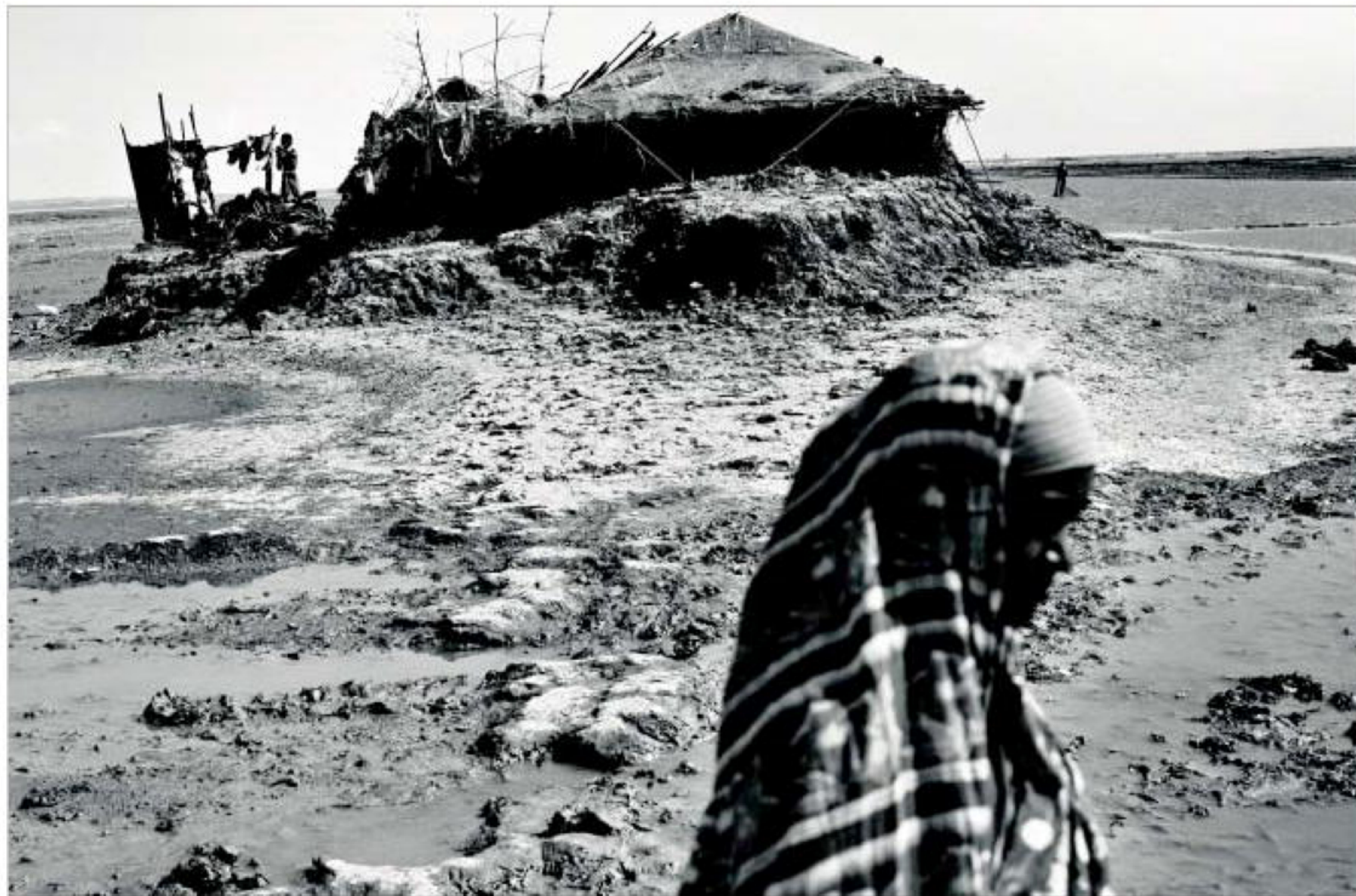
KUZIARTEK. Ved nymåne og fuldmåne stopper tidevandet først ved indgangen til hytterne i Kuziartek. Så går der tre dage, før indbyggerne kan bevæge sig ud igen.

Engang var Kuziartek en større landsby med rismarker, skoler og moskeer. I dag er der kun et lille stykke mudret jord midt ude i Bengalbugten tilbage. Resten er blevet taget af havets bølger. Det lavtliggende Bangladesh er et af de lande, der er umiddelbart truet af klimaforandringerne. Dele af landet er allerede hårdt ramt af erosion fra havet. Og endnu mere land vil forsvinde, hvis klimaekspertes far ret i deres prognoser om stigende vandstande og flere storme.