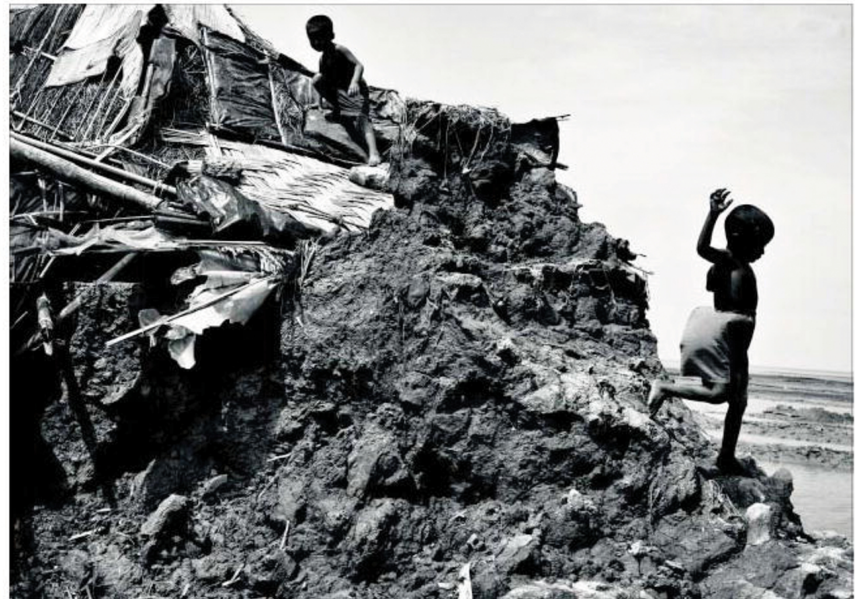
KUZIARTEK. Børn leger på ruinerne af et hus, der er sunket sammen i den sidste storm.